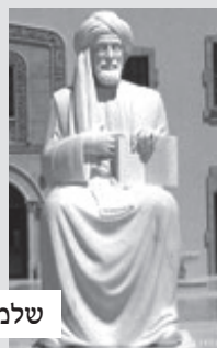
שלמה אבן גבירול