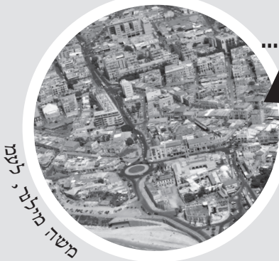
משה מילר, לעמ