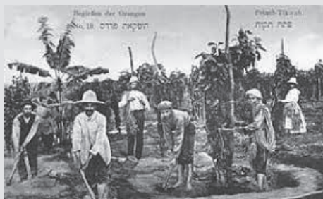
ארכיון אילן חוט

עקב כל הצרות הללו, התרוששו רבים מהמתיישבים מנכסיהם, והחלה עזיבה רבה גם בקרב הוותיקים והמייסדים. הפתח-תקוואים התנחמו בעבודה שהשנה הבאה היא שנת שמיטה, שנה שבה ממילא העבודה אסורה. לקראת שנת השמיטה, נפוצו המתיישבים בין יפו לירושלים בתקווה לשוב לקרקע כעבור שנה בכוחות מחודשים. אחרי שנת השמיטה התושבים חזרו,