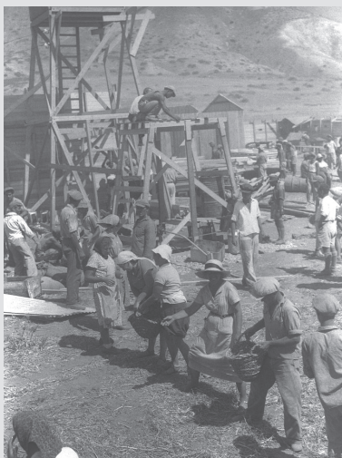
לשכת העיתונות הממשלתית

"הכנת המחנה נחלקה בין משקי העמק - גשר מכינה את המגדל ואת חדר האוכל, אפיקים את החומה, קבוצת כנרת את הצריפים ואנחנו את הגדר החיצונית, גדר החוטים וכל מה ששייך לחשמלאות ומסגרות. ערב העלייה באו חברינו מכל הארץ. באו הרבה אורחים מהסביבה הרחוקה והקרובה; באו גם נגרים מכפר גלעדי וטפסנים מגבעת חיים. עד שעה מאוחרת בלילה עבדו החברים במסגרייה. החברות עבדו במטבח והכינו את האוכל ליום העלייה. בשעה שלוש, בעוד חושך, הכול היה מוכן לדרך. בשלושה אוטומובילים הגענו לאפיקים. לכאן התאספו אנשי הסביבה שהשתתפו בעליה. מסע הכיבוש, שתיים עשרה מכוניות משא מלאות אנשים עמוסי משא והמון מכוניות קטנות עברו דרך מסדה ועין הקורא סבבו את צמח עד הגיעם לעין גב... כעבור רגעים מספר התחילה העבודה. ארבע מאות איש עבדו במהירות ובקצב... הטורייה גרפה את החצץ לתוך הפחים, מן הפחים