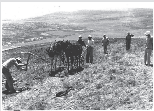
מרכז מורשת גוש עציון

ובמאמץ רב החלו להתגבר על ההר הטרשי, על האדמה הקשה ועל בעיות הפרנסה הקשות שבפניהן עמדו. נחצבו בריכות מים, נבנו טראסות חקלאיות, ניטעו מטעים, הוקמו ענפי חי - רפת ולול - הוכשר בית הבראה ומרגוע, נעשו הכנות להקמת מפעל תעשייתי למכניקה עדינה ולהפעלת מחצבה. חיי תרבות תורנית וכללית עשירים התנהלו בבניין נווה עובדיה,