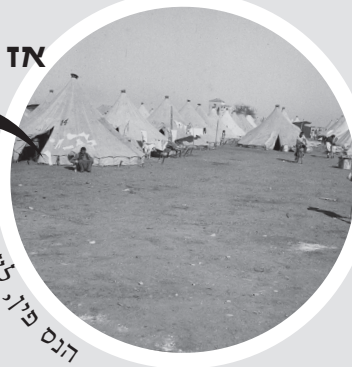
הנס פיו, לעמ